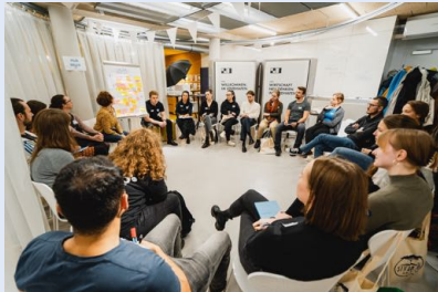
Kick-Off Veranstaltung 2022